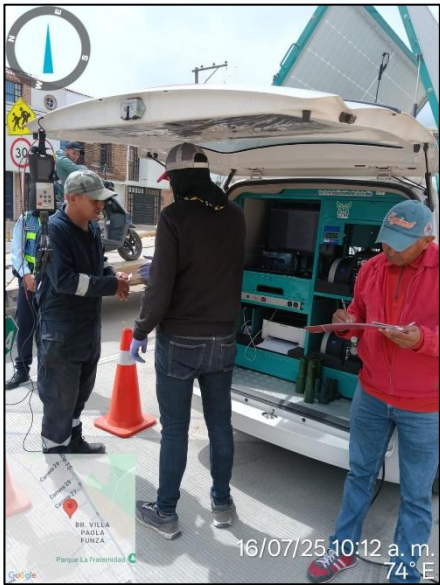
Ilustración No. 3. Operativo pedagógico fuentes móviles.