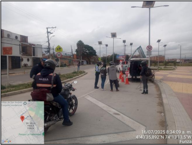
Ilustración No. 2. Operativo pedagógico fuentes móviles.