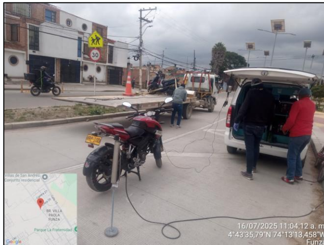
Ilustración No. 4. Operativo pedagógico fuentes móviles.

C.P 250020 Tel. (601) 8234070 823 40 71 / 823 40 73 Fax. (601) 8257620 Dir. Cra. 14 No. 13-05